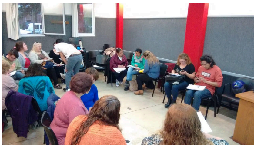
Foto N°3: Curso de Costos para costureras domiciliarias, realizado en ADUM, Noviembre 2018