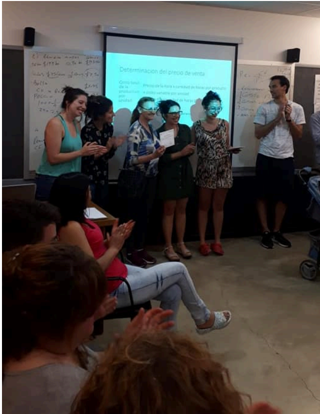
Foto N°4: Entrega de diplomas Curso de Costos para costureras domiciliarias, realizado en ADUM, Noviembre 2018.

Asimismo, los participantes manifestaron la necesidad de socializar, y tener espacios de encuentro que permitieran intercambiar ideas, debatir problemáticas y definir estrategias para mejorar su situación laboral. También se esbozó como estrategia posible, la posibilidad de asociarse en un espacio común que permitiera reducir estos costos, como también la importancia para generar compras comunitarias de materia prima y/o pautar listas de precios mínimos estandarizadas en base a esta información. Los cuales están asociadas a las estrategias de la importancia de la sociabilización y asociación entre pares.