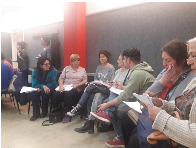
Foto N°2: Curso de Costos para costureras domiciliarias, realizado en ADUM, Noviembre 2018