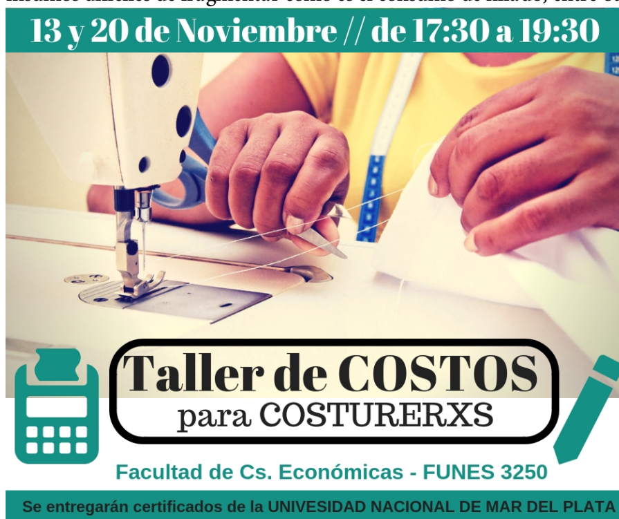
Foto N°1: Cartel de promoción del Curso de Costos para costureras domiciliarias, que se difundió a través del sindicato en redes sociales.