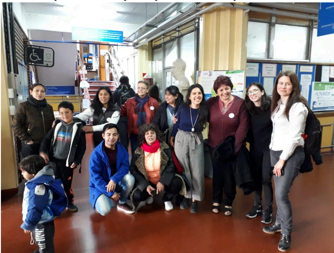
Foto N°7: Reunión con las costureras domiciliarias en la Universidad Nacional de Mar del Plata, para la generación de una mesa interdisciplinaria.

Finalmente, es interesante vislumbrar cómo la falta de articulación armónica de los diversos eslabones productivos genera relaciones débiles o asimétricas dentro de la industria regional textil e indumentaria; que a su vez proporciona menor desarrollo competitivo a nivel productivo y social. También es interesante analizar cual es la responsabilidad del Estado para que a través de sus políticas asevere las condiciones en las que se encuentran trabajando las trabajadoras domiciliarios. Comprender que la singularidad del trabajo tercerizado, en definitiva responde a lógicas globales de organización laboral, cuya invisibilización hace emerger problemas más del tipo sociales, y que por consecuencia, se evidencian de forma cuantitativa en el aspecto de desarrollo económico. De esta manera considero pertinente comenzar a integrar en el entramado social a estas esferas productivas, visibilizando su origen en el mercado informal, identificarlo, reconocerlo, y valorarlo su cualidades positivas, puede ser una de las primeras medidas para empoderar este eslabón productivo.