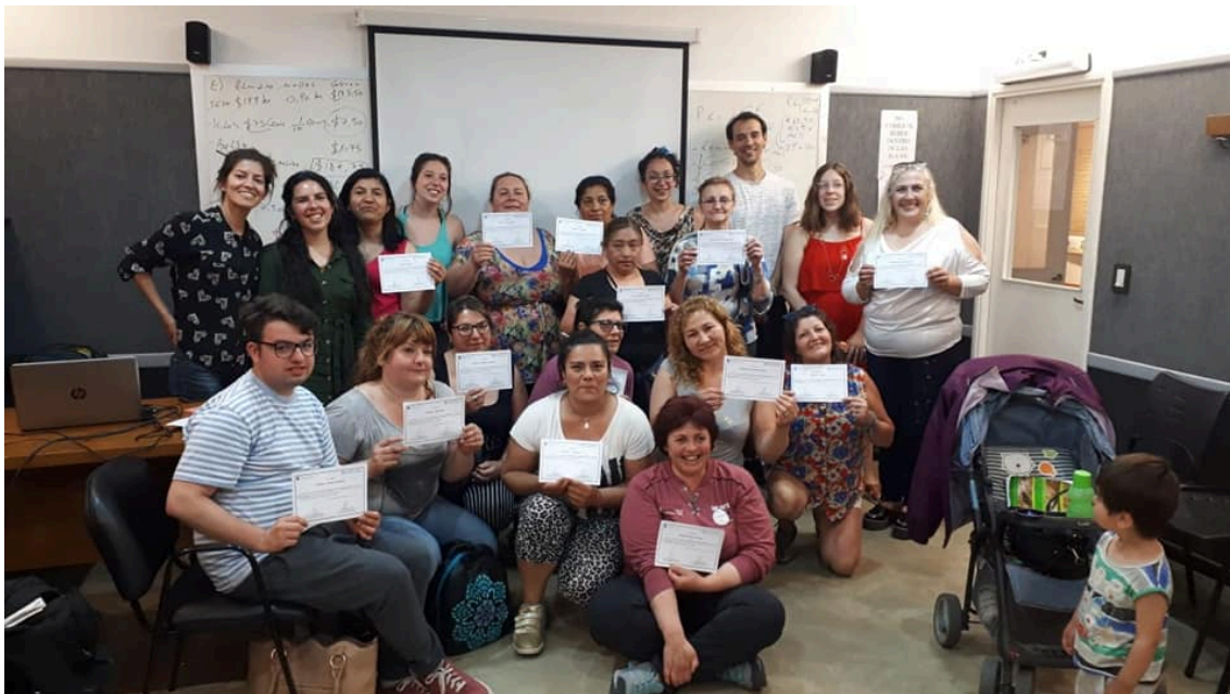
Foto N°5: Entrega de diplomas Curso de Costos para costureras domiciliarias, realizado en ADUM, Noviembre 2018.

“Últimamente como estoy en el sindicato no te vienen a ofrecer ningún tipo de trabajo para fábricas. Ahora puedo decir que cobro mejor te reconocen mucho mejor el trabajo, no me pelean tanto el precio, me dicen presupuéstalo, si es verdad que he cobrado muchas veces poco ... porque tenés miedo de cobrar lo que vale, que nos ha pasado a todas, y esto de estar cerca del sindicato me ha ayudado a valorarlo un poco más, porque la verdad es que regalábamos trabajo y no lo sabíamos... pero lo regalábamos mal, y ahora hace poco hice un curso de costos el que vos organizaste ¡Te despierta!”