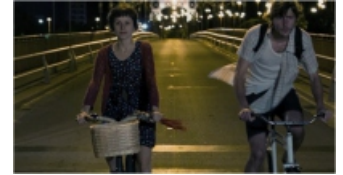
Fig. 25-26-27. Tensión horizontal y vertical y la cámara girando alrededor de los personajes, donde se erige el lugar sobre la extensión del paisaje.

A partir de analizar este cortometraje se puede sintetizar que la experiencia de este tipo de filmación contribuye un aporte al reconocimiento del espacio urbano. Por un lado, al potenciar el ' paisaje en movimiento ', como se mencionaba al principio de esta parte, en este caso logrando una imagen dinámica o cinestésica de los aspectos significativos entre las direcciones horizontal y vertical del espacio habitado. Por otro lado, el film recrea una mayor conciencia sobre el uso de las atmósferas, coincidiendo en lo que Pallasmaa sostiene, al considerar el aporte del cine como esencial. En este caso la atmósfera permite una inmersión estética de ambas direcciones mencionadas; a partir de recrear una combinación sinestésica, en la unión de imágenes sensorias.