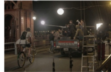
Fig. 24. Imagen del rodaje del cortometraje "Puente" 2015. Donde el equipo de filmación se monta en un vehículo de modo de acompañar la aceleración y desaceleración del participante.

recrean, visible en la imagen inferior 24; en esos instantes de la escena, la cámara capta en el movimiento en el paisaje del fondo, incorporándolo a escenas al acompañar al vaivén del personaje. Aquí, el paisaje adquiere esa característica de dinámico y a la vez requiere de la construcción del sujeto, como menciona Bachelard refiriéndose a los ensueños, "los ensueños de la voluntad se desarrollan temas necesariamente precisos de la construcción demiúrgica: el paisaje se hace carácter. Sólo se le comprende dinámicamente cuando la voluntad participa en su construcción" 23 .