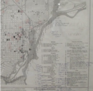
Fig. 22-23. Algunos de los puntos del Mapeo elaborado sobre un plano de Santa Fe por Saer, ante la consulta de un profesor de Francia sobre los lugares que le inspiraron y a los cuales refirió en sus obras son: "1. Trayecto de Leto y el matemático en 'Glosa'"; "8. La terminal"; "4. Diario 'La región'"; "5. Av. del puerto"; "6. El puerto"; "7. Terminal de ómnibus vieja"; "8. La terminal nueva".

era la ciudad hace treinta años y lo que Saer imaginó." Aclara el director Beceyro, que la avenida Alem podía otra y sin duda se reconocen dentro de las características del clima local. "Ya no se sabe si el diario de Santa Fe se llama El Litoral o La Región , como en las narraciones de Saer, y si la avenida Alem no es en realidad la Avenida del Puerto ." 19