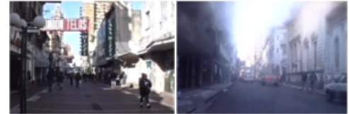
Fig. 18-19. Fragmento de "Mirada 3. Ciudad". En cd Beceyro, Raúl. «Imágenes de Santa Fe.» En "Cine y Región. Ensayos, proyectos y películas" Colecc. El País del Sauce, Paraná: EDUNER, 2017.

En este fragmento analizado, la estética del caminar en la ciudad se recompone a través del personaje narrado por Saer; es decir, el movimiento de la cámara se desarrolla siguiendo a un peatón, en un tiempo continuo o presente como suele llamarse; este desplazamiento paso a paso sobre el protagonista es acotado a un sector urbano reducido, visible en las imágenes 18-19. En las cuales, la envolvente se figura en el espectador, a través del paso a paso de la cámara, y se da en la interacción entre el cenit que se acentúa con la proximidad de las fachadas continuas y el movimiento constante.