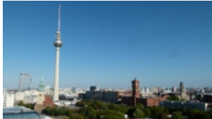
Fig. 1. "Berlin".