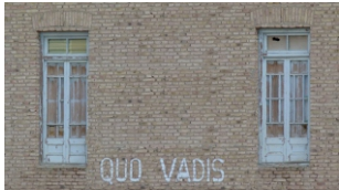
Fig. 6. "Graffiti en Maquinchao".

para otras finalidades, si ella se presenta tal y cual la cámara la captó con sus recursos técnicos o fue extremadamente procesada en el momento posterior a la toma mediante recursos electrónicos. Lo único que realmente importa es lo que el cineasta hace con esos materiales, cómo construye con ellos una reflexión rica sobre el mundo, cómo transforma todos esos materiales inertes y en bruto en experiencia de vida y pensamiento".