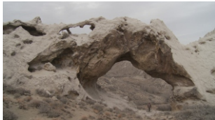
Fig. 5. "Adonde vas". 2018.