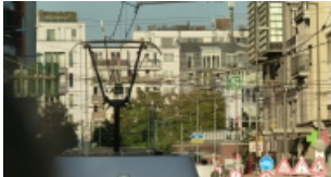
Fig. 3. "Cables".

hileras de edificios bajos, grises, con canteros y espacios verdes descuidados, calles mal señalizadas (Schaperstrasse, Joachimsthaler por citar algunos fallos) y poco iluminadas, los graffittis expresión de la época, restos de afiches de papel en todas las superficies y los caños que cruzan las avenidas para evacuar el limo y el agua de donde está fundada, bien podría pasar -por esto- por cualquier gran ciudad sudamericana.