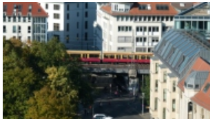
Fig. 2. "S-Bahn".

Desde la ventanilla, la primera postal empaata con mi construcción y expectativa; techos a dos aguas, de pizarra y rojos asoman entre el verde de un bosque dividido por un río; precisión, prolijidad, el orden germano a la vista; nada que provoque mi admiración por ello, particularmente si contara con un espacio verde y tiempo, optaría por tener lechones como mascotas en lugar de flores.